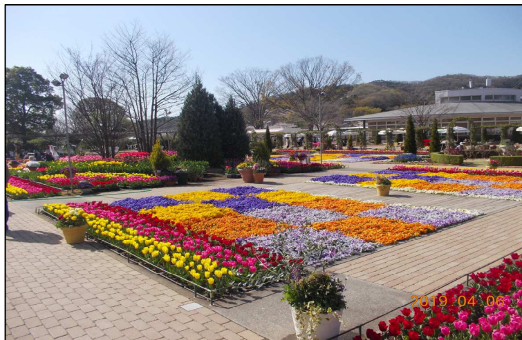
1日目 足利ハラワパーク